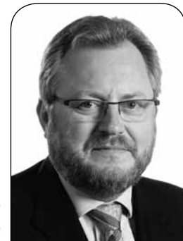
Jean-Claude Reding Président de la Chambre des salariés

La présente publication de la Chambre des salariés s'inscrit dans l'Initiative « Making Luxembourg », initiative animée par l'Association de Soutien aux Travailleurs Immigrés (ASTI) et qui a comme objectif de réagir contre les discriminations et de sensibiliser le public aux dangers des discriminations raciales et sociales. L'initiative regroupe des partenaires de la société civile, dont la Chambre des salariés, qui s'engagent à œuvrer dans ce sens.